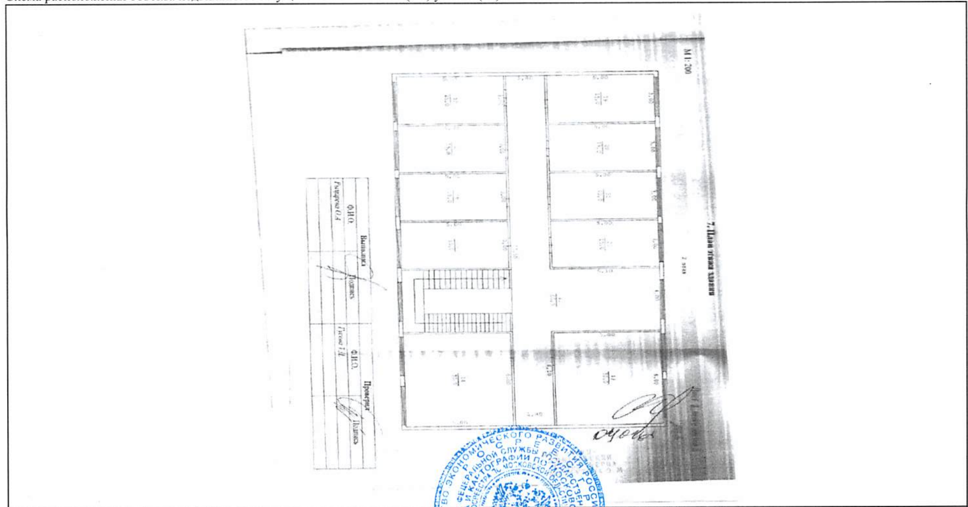
Схема расположения объекта недвижимого имущества на земельном(ых) участке(ах):